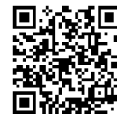
ペーパー試験 申込サイト