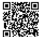
ネット試験 申込サイト